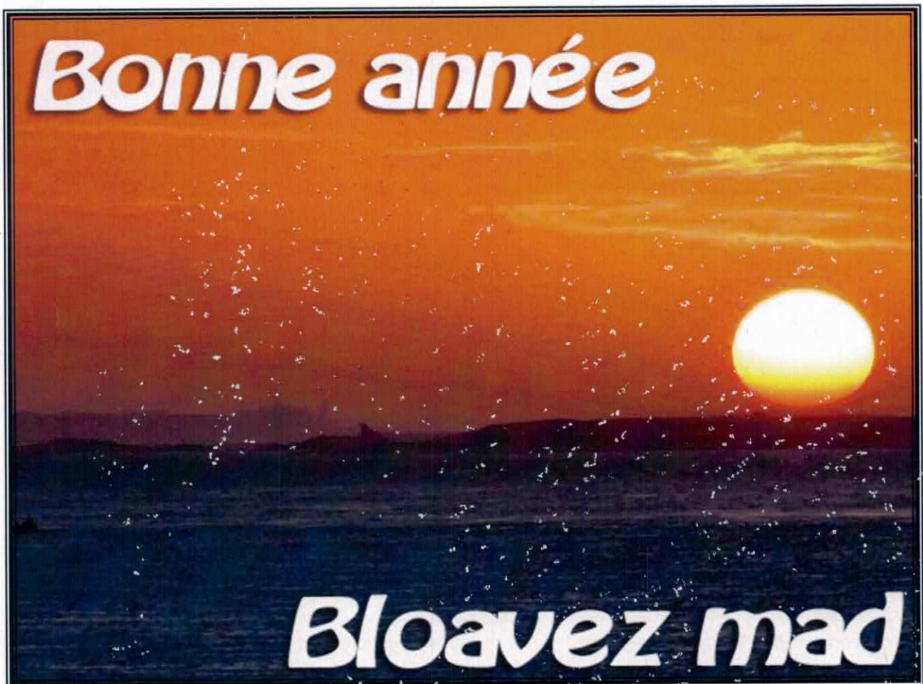
Lever de soleil sur le continent