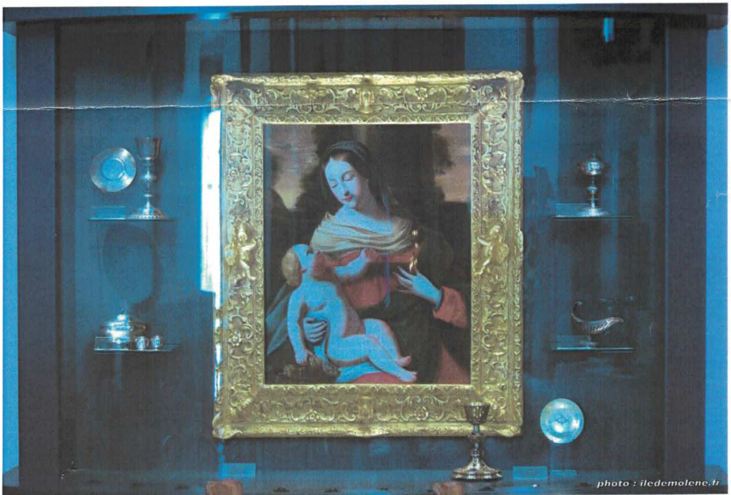
La vierge et l'enfant - Vitrine de l'église Saint-Ronan de Molène