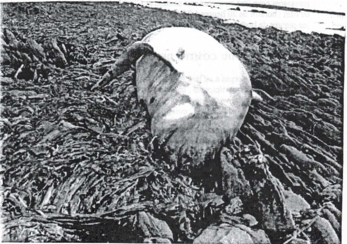
Globicéphale de 6m20 échoué sur Triélen ~ ~

La prochaine composition de ce comité de gestion sera de quatre partenaires égaux , dont une représentation des usagers ( ce que fait déjà l'Amicale depuis des années ).