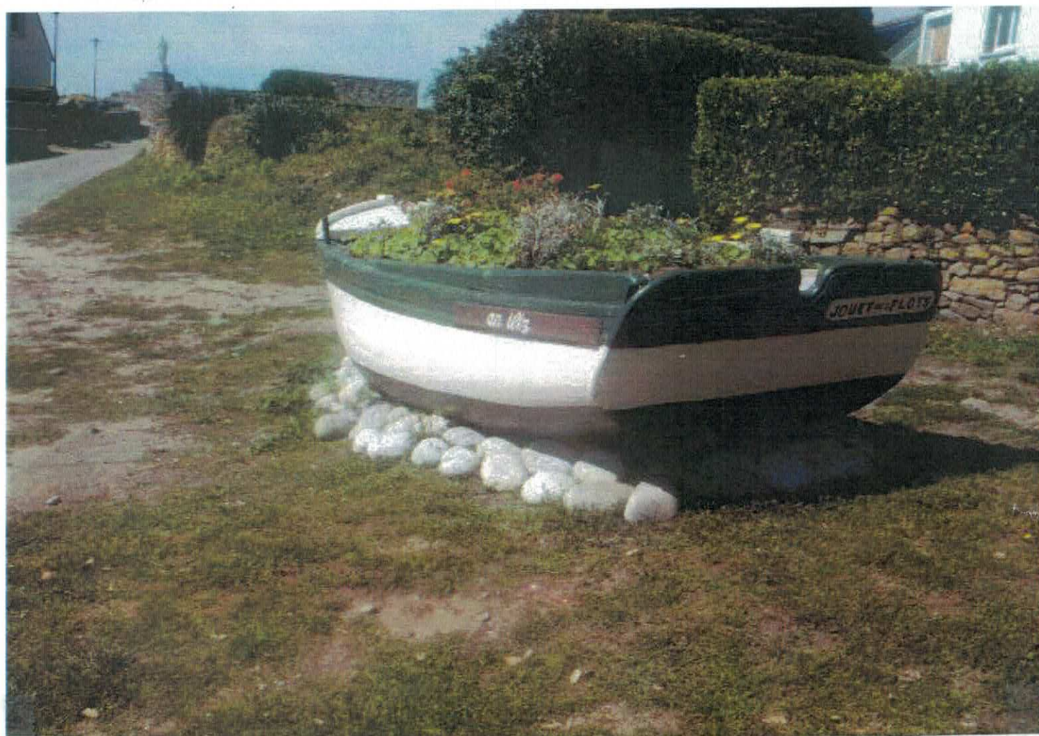
“LE JOUET DES FLOTS” CANOT FLEURI PRES DE L'EGLISE