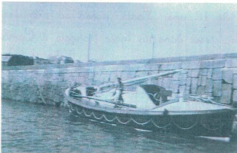
LE JEAN CHARCOT A QUAI AUX ILES SCILLY