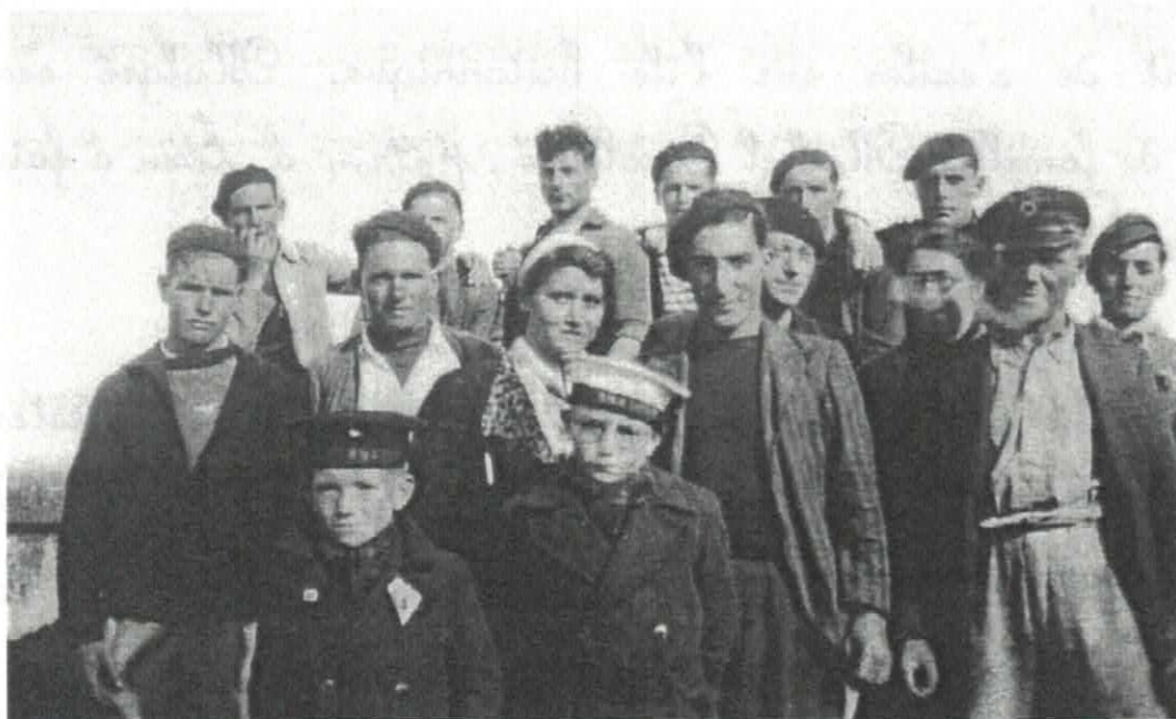
'MOLENAIS AYANT REJOINT L'ANGLETERRE EN 1940 (texte page suivante)