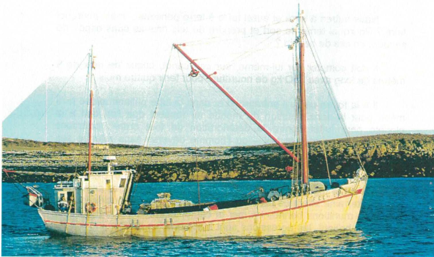
La Fée entrant au mouillage de Molène; on distingue au fond l'îlot du Grand Lédénès.