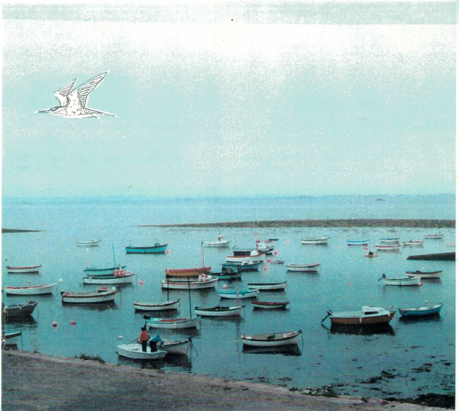
PORT DE MOLENE . AOD, AR VAG . GRÈRE LOS BATEAUX.